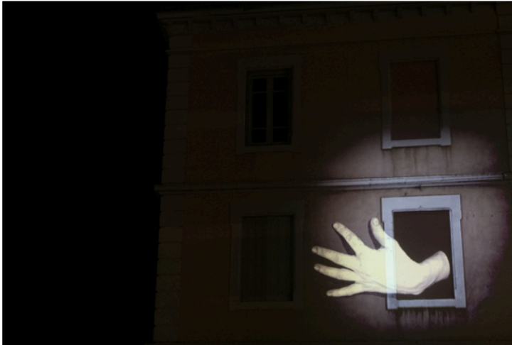
Projecció de «Behind the walls» de Nathalie Mauphroy

«Els espais amb els quals treballem són molt fluids, comptem amb un entorn prou ample per a involucrar-hi les escoles. El que volem és posar als alumnes al radi dels artistes». Güell apunta que l'objectiu és convertir el festival en un laboratori. «Volem que tot estigui viu». En aquest sentit, la directora destaca com la metodologia de programació del festival ha anat evolucionat al llarg del temps. «Els festivals, normalment, acaben adaptant algunes de les seves pretensions inicials per motius de rendibilitat. Optimitzem, sí, però no ens podem permetre repetir el mateix model de sempre, ja que caiem en el perill de perdre frescor pel camí. No ho hem de sotmetre tot a l'efectivitat».